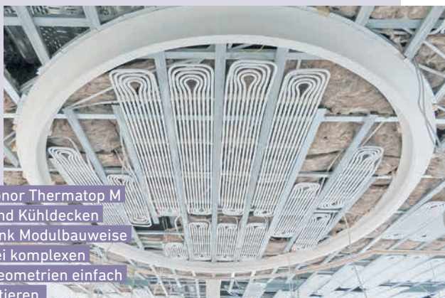
Die Uponor ThermoTop M Heiz- und Kühldecken sind dank Modulbauweise auch bei komplexen Raumgeometrien einfach zu montieren.

angenehme Gefühl, beispielsweise vom Sommerurlaub. Während es draußen drückend heiß ist, genießt man die Besichtigung einer alten Kirche, einer Höhle oder eines steinernen Kellers sogar dann, wenn man kein Kulturfan ist.