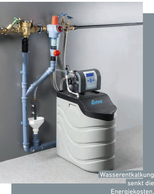
Wasserenthärtung senkt die Energiekosten.