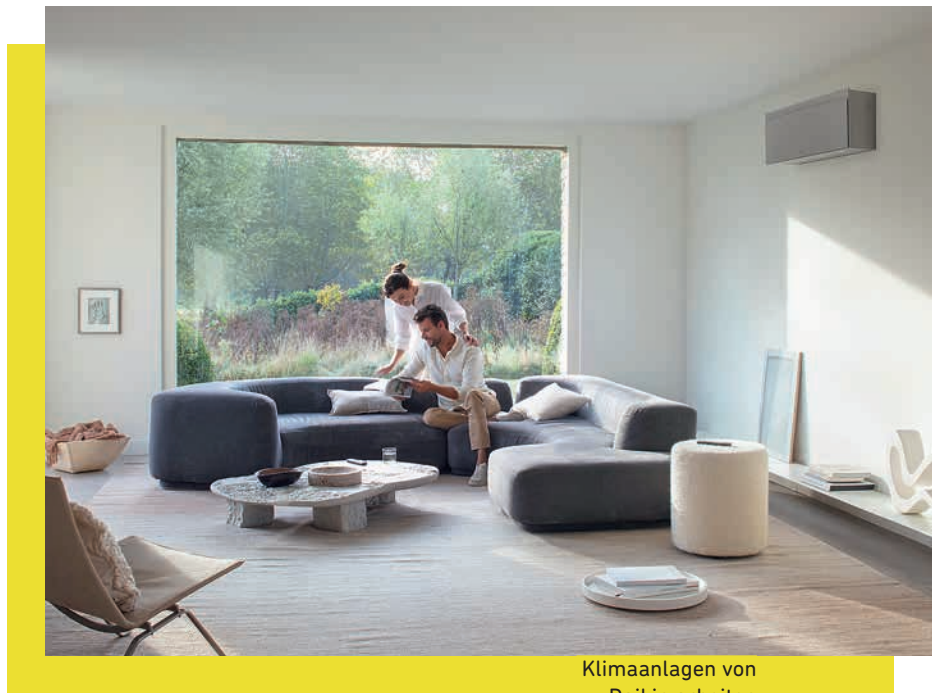
Klimaanlagen von Daikin arbeiten hocheffizient und sehen dabei auch noch super aus.

an Pollen, Viren und Co. kann damit stark verringert werden. So können alle aufatmen – und zwar im Sommer genauso wie im Winter!